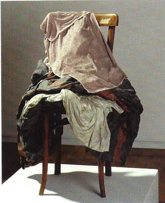
DET ORDINÆRE: Tàpies arbeidet direkte med dagligdagse gjenstander og kombinerte dem på en måte som signaliserte noe uhyttelig, kroppslig og hverdagslig i vårt forhold til objekter. Cadira i roba , (Stol og klær), 1970.