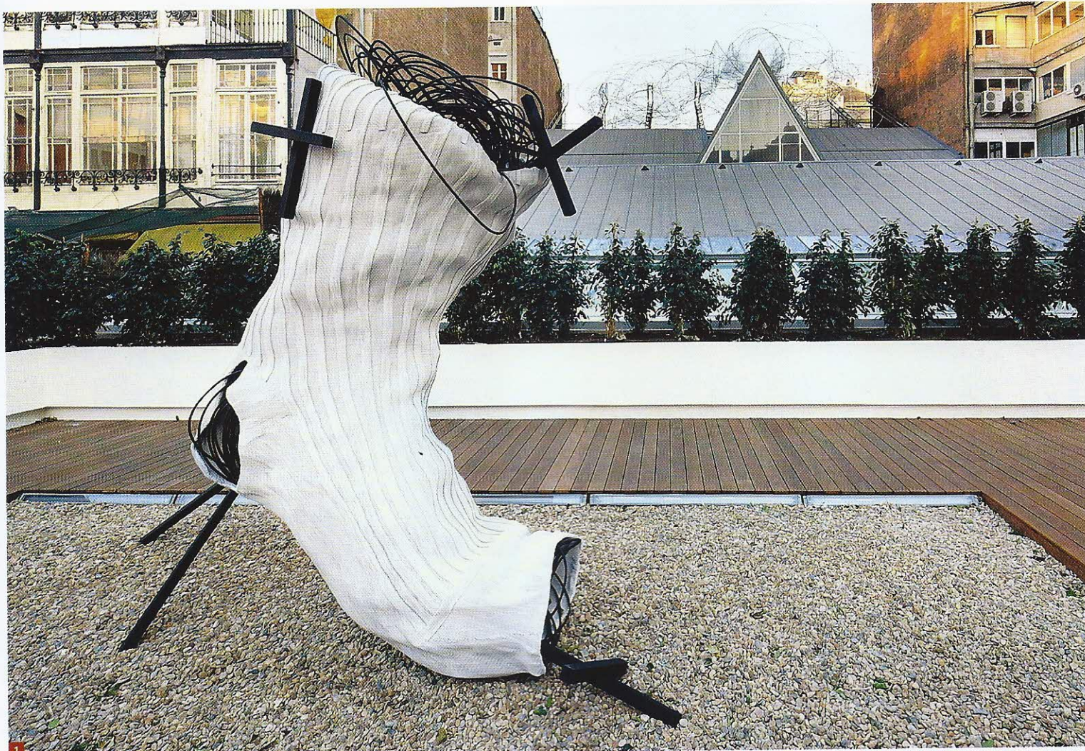
1: GLAD I SOKKER: Tàpies ønsket å utsmykke det katalanske nasjonalgalleriet med en kjempesokk på 18 meter. Da han ikke fikk gjennomslag, plasserte han denne på beskjedne 3 meter i sitt eget kunstgalleri i Barcelona. Mitjó (Sokk) , 2010.