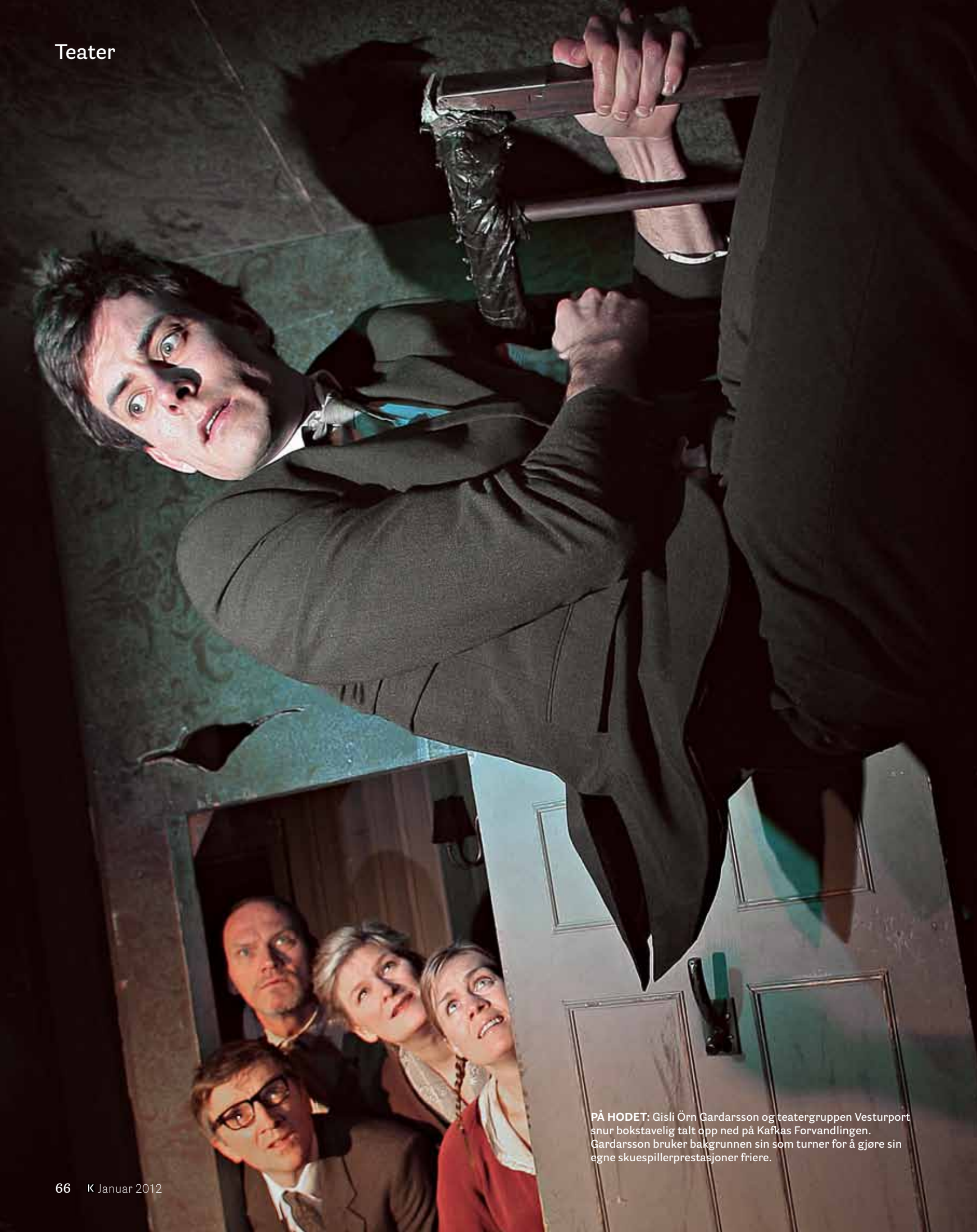
PÅ HODET: Gisli Örn Gardarsson og teatergruppen Vesturport snur bokstavelig talt opp ned på Kafkas Forvandlingen. Gardarsson bruker bakgrunnen sin som turner for å gjøre sin egne skuespillerprestasjoner friere.