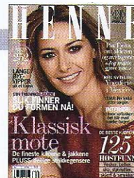
Styling: Margrethe Gilboe Hår og makeup: Sissel Fylling